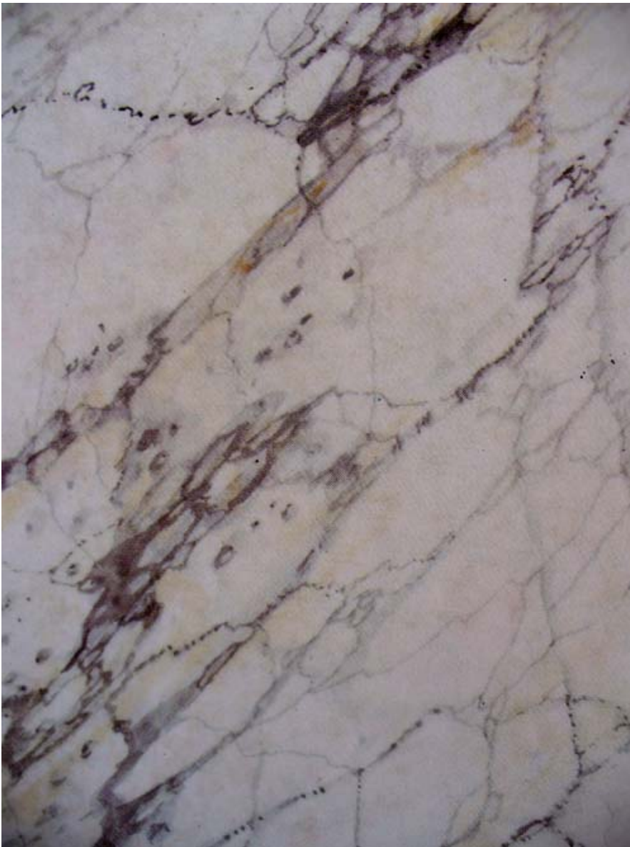
Carrara eller Blanc Veiné